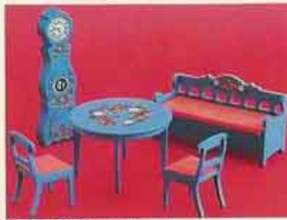
NYHET 9321 Matsal Leksand 4403 matbord + 2 stolar 4405 allmogesoffa 4415 moraklocka, 4404 stol