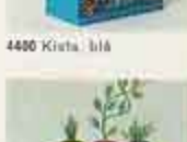
4480 Kista, blå