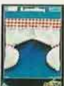
6330 Gardin Gilla