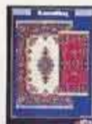
6284 Mattor Bagdad