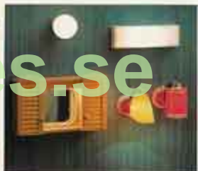
6121 Kökskupa 6123 Lysbr NYHET 8850 Badrumsskåp med lampor 6171 Lampett gul 6173 Lampett röd siden