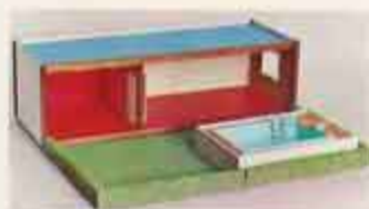
6050 Bottenvåning, 6054 Trädgård med swimmingpool