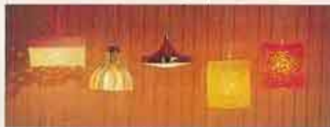
6177 Taklampa spots, 6144 Taklampa kristall, 6135 Taklampa koppar, NYHET 6134 Taklampa råkristall, gul eller orange

Titta så många nyheter. Här finns tre nya bordslampor, fyra nya taklampor och tre nya golvlampor som du inte sett förut. Och så naturligtvis det nya tjuvigade badrumsskåpet med inbyggd belysning.