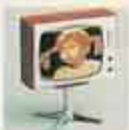
NYHET 8196 Färg-TV Pippi Långstrump