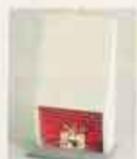
5773 Döpsen spis med belysning