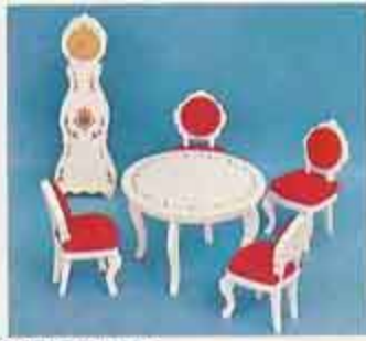
9404 Matsal Diné 4260 stol 4313 bord + 2 stolar 4315 moraklocka