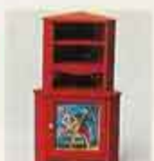
4454 Hönsskåp, röd