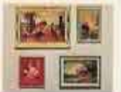
6815 4 tavlor 6816 4 tavlor, varav 1 med belysning