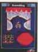
6328 Gardinset, bök