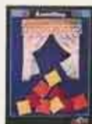
6310 Gardinset, vandagsrum