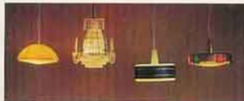
NYHET 6124 Taklampa gul, 6142 Kristallkrona, 6133 Taklampa vit/blå, NYHET 6136 Taklampa mässing m. prismor

Till Lundby dockskåp finns också massor av lampor. Taklampor, golvlampor, bordslampor och väglampor. Och alla lyser och sprider trivsel i huset. Välj själv vad du behöver!