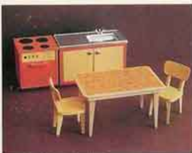
NYHET 9270 Köksmöbel 2501 köksbord + 2 stolar 2530 köksspis 2540 diskbank