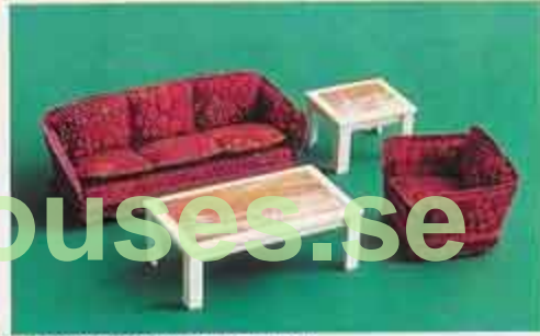
NYHET 9532 Salong Nya Romance 5340 soffa Romance, 5350 fätöjl Romance 5312 soffbord med motiv 5315 lampbord med motiv