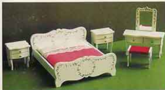
NYHET 9771 Sovrum, rokokostil 4321 dubbelsäng med bädd 4323 toalettbord + pall 4324 nattbord