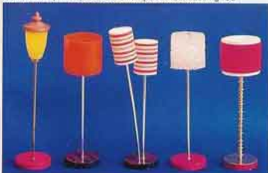
6156 Altanlykta 6151 Golvlampa enkel NYHET 6154 Golvlampa dubbel, röd NYHET 6159 Golvlampa, råkristall NYHET 6158 Golvlampa röd sammet lyx