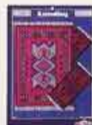
6283 Mattor Balken