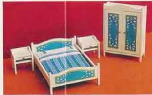
NYHET 9716 Sovrum Blue Heaven 7103 nattbord 7166 dubbelsäng med bädd 7186 klädskåp