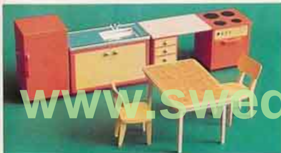
NYHET 9272 Köksmöbel med kyl 2501 kökabord + 2 stolar 2530 köksspis, 2540 diskbank 2583 kylskåp, 2571 arbetsbank