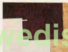
8286 4 hallfärgningsmattor