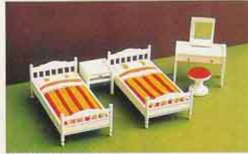
NYHET 9717 Sovrum, vitt 7103 nattbord 7115 toalettbord + pall 7265 enkelsäng med bädd