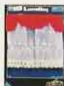
6340 Gardin Empire