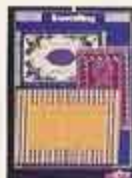
6282 Mattor Desirée