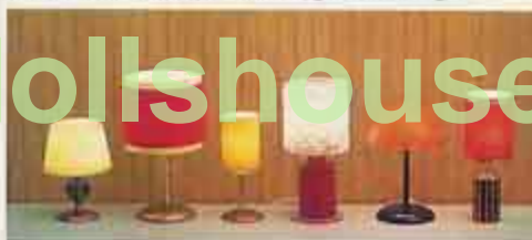
6162 Bordslampa glasfot, NYHET 6167 Bordslampa röd sammet lyx, 6163 Bordslampa gul siden, NYHET 6166 Bordslampa råkristall, 6165 Läslampa röd, 6164 Bordslampa räfflad mässing röd