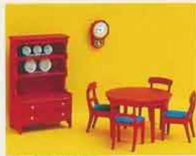
9305 Matsal, röd allmoge 3115 bord + 2 stolar 3125 stol, 3135 väggur 3185 skåp