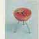
6179 Grill med glödlampor i kök