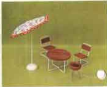
9801 Trädgårdsmöbel — 8613 trädgårdsbord + 2 stolar, 8614 parasoll, 6179 grill.