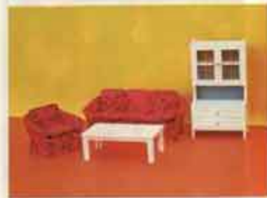
Nyhet 9530 Salong Romance — 5310 soffbord, 5340 soffa, 5350 fåtölj, 5381 vitrinskåp.