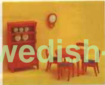
Nyhet 9305 Matsal, röd allmog — 3115 bord + 2 stolar, 3125 stol, 3135 väggur, 3185 skåp.