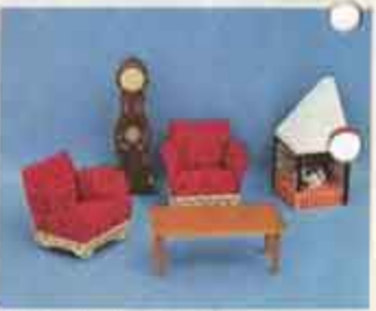
9501 Fätöljgrupp med spis — 3430 golvur, 5200 fätölj, 5515 öppen spis.