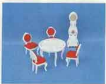
9404 Matsal Dinée — 4260 stol, 4318 bord + 2 stolar, 4315 moraklocka.