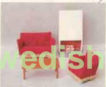
9502 Soffgrupp med spis — 5200 fätölj, 5210 soffa, 5773 öppen spis.