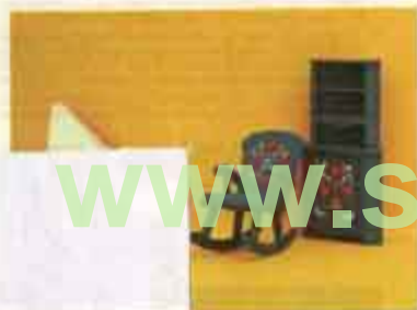
Nyhet 9520 Möbel Leksand — 4329 gungstol, 4453 hörnskåp, 5515 öppen spis, 5772 vedkorg.