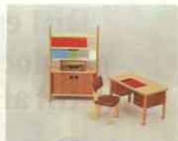
9512 Bibliotek — 5412 skrivbord + stol, 5492 radio, 8-860 bokskåp.