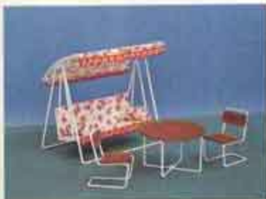
9802 Hammockmöbel — 8613 trädgårdsbord + 2 stolar, 8647 hammock.