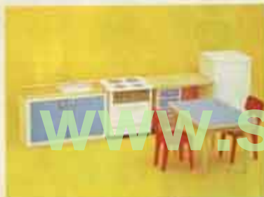
9272 Köksmöbel med kyl — 2501 köksbord + 2 stolar, 2530 köksspis, 2540 diskbänk, 2583 kylskåp.