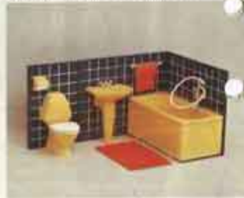
9880 Badrum, kakel — 8817 wc-stol + matta, 8818 tvättställ + handduksvägg, 8819 badkar.