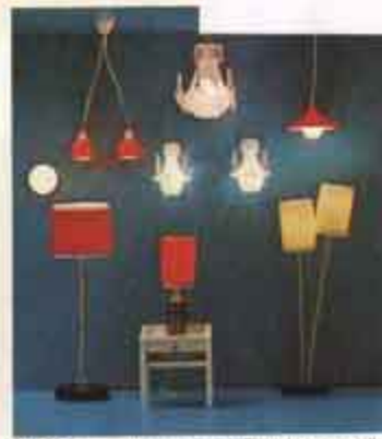
8152 Golvampa, två sammal. 8164 Bordslampa, rött glas. 8154 Golvampa, basstjärna. 8121 Kökslampa. 8132 Taklampa, dubbel. 8143 Kristalllampetter. 8142 Kalkskåp. 8122 Taklampa, vit.