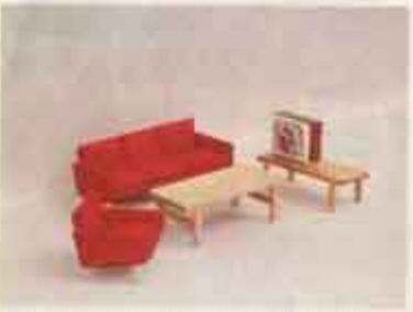
9510 Soffgrupp, skinn — 5111 soffbord, 5148 soffa, 5158 fätölj, 5194 TV + TV-bänk.