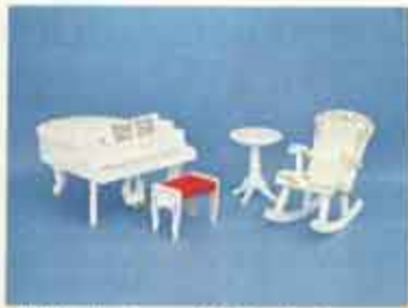
9419 Musiksalong — 4113 pelarbord, 4318 flygel + pall, 4327 gungastol.