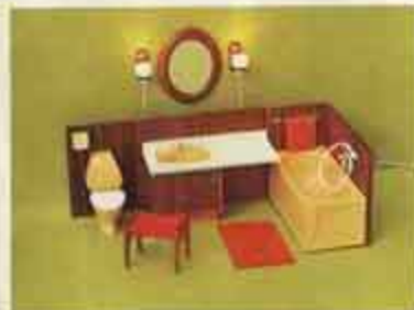
9887 Badrum, m. lampetter — 8837 wc-stol + handduksvägg, 8838 inbyggt tvättställ + spegel, 8839 badkar + matta, 6178 spegellampetter, 9886 Badrum = 9887 utan 6178 spegellampetter