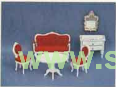
9414 Salong Theräe — 4250 soffbord, 4260 stol, 4270 soffa, 4325 byrå, 6853 spegel.