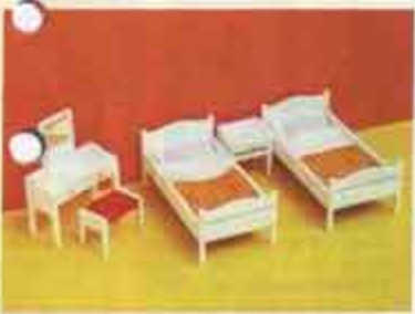
9710 Sängkammare, vit — 7103 natt- bord, 7115 toalettbord + pall, 7263 enkelsäng, bäddad.