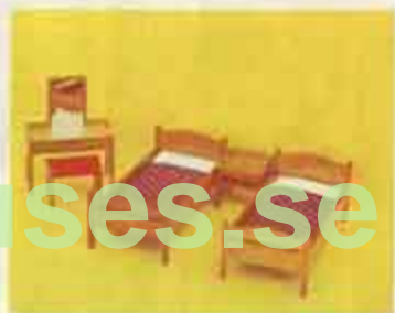
9730 Sovrum, mahogny — 7102 nattbord, 7114 toalettbord + pall, 7262 enkelsäng.