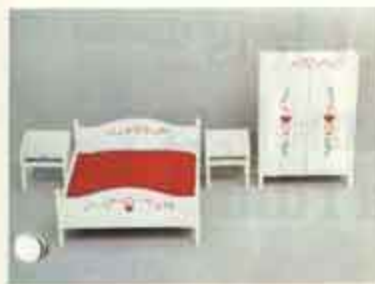
9790 Sovrum, allmogedekor — 7103 nattbord, 7163 dubbelsäng, 7184 klädekap.