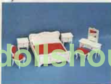
9770 Sovrum, rokok — 4260 stol, 4321 dubbelsäng, 4323 toalettbord + pall, 4324 nattbord.