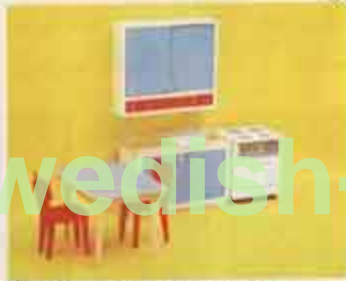
9250 Köksmöbel med skåp — 2501 köksbord + 2 stolar, 2530 köksspis, 2540 diskbänk, 2550 köksskåp, 9270 Köksmöbel = 9250 utan 2550.