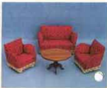
9500 Soffgrupp, stoppad — 5200 fätölj, 5210 soffa, 5250 soffbord.