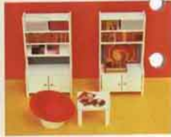
Nyhet 9540 Studio Stereo — 5313 lampbord, 5382 bokhylla, 5383 d.o med fidskriftshylla, 5455 POP-fåtölj, 5493 skivspelare.