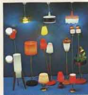
8199 Golvampa, 3 bän. 8131 Golvampa, enkel. 8162 Bordslampa, glasblå. 8153 Golvampa, dubbel. 8151 Bordslampa, trästol. 8156 Afrikanskt. 8163 Bordslampa, ett sidan. 8167 Bordsbord med lampor. 8173 Lampett, 100 st. 8131 Taklampa, massal. 8171 Lampett, gul. 8133 Taklampa, vitblå. 8177 Taklampa, svart. 8178 Spegellampetter.

Lundsby har även ett stort utbud av andra miniatyrlampor. Ett stort utbud av andra miniatyrlampor. Ett stort utbud av andra miniatyrlampor.