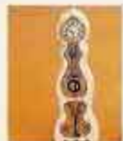
NYHET! 4364 Klocka Royal