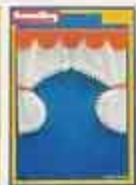
6330 Gardin, Grön