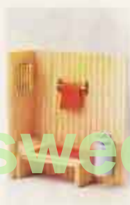
8860 Bastu m. lampa