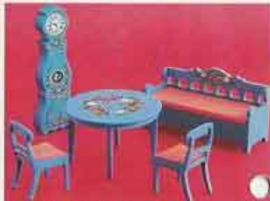
9321 Matsal i Leksand 4403 Bord, två stolar, 4404 Stol 4405 Allmogesoffa 4415 Meraklocka