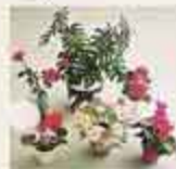
6605 Sex blommor