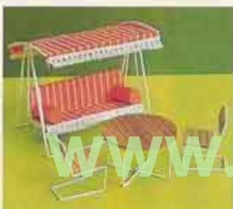
9803 Trädgårdsmöbel Hammock, trädgårdsbord, två stolar (ej blisterpack)