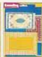
6282 Mattset Desiré