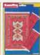
6283 Mattset Belkan