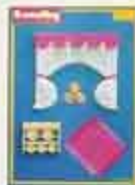
6320 Gardinset, kök