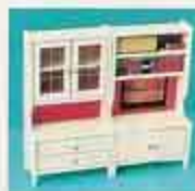
5381 Vitrinskåp 5382 Bokhylla