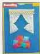
6350 Gardinset, varlängsrum