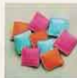
NYHET! 6610 Nio kuddar