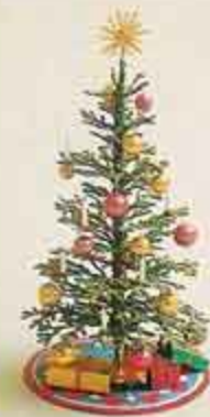
NYHET! 8981 Julstrå En underbart vacker julgran, med julgransmatta.