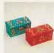
4400 Kista, blå 4401 Kista, röd