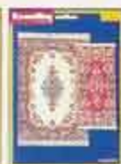
6284 Mattset Bagdad