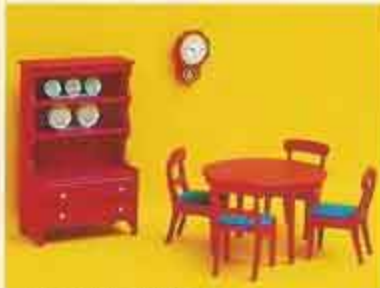
9305 Matsal, röd allmog 3115 Bord, två stolar 3125 Stol 3135 Våggur 3185 Skåp