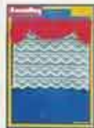
6340 Gardin Empire