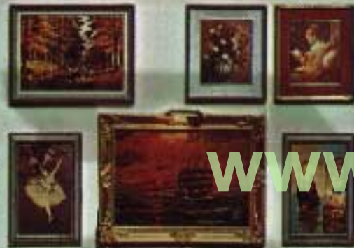
Exempel ur Lundby tavelsortiment: 4 Tavlor 6615. 4 Tavlor, varav en med belysning 6616.