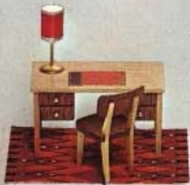
Skrivbord med Stol 5412. Bordslampa 6163.