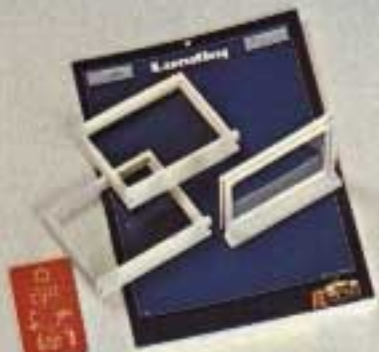
Sät med tre fönster 6301. Är avsedda att monteras i gamla Lundby-dockskåp.

9887 D.o. med lampetter, Enheterna finns även i tre småförpackningar: 8837 WC-stol, 8838 Tvättställ, 8839 Badkar, 8860 Bastu med lampa, furupanel.