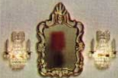
Småförpackning: 6643. Spegel 6853 och två kristall-lampetter 6143.