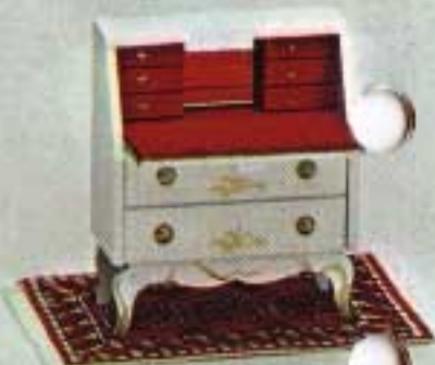
Sekretär med spegel och fällbar klaff 4316.

Kartongförpackningar: 9500 Tygklädd Soffa med stoppning 5210, två Fätöljer 5200, Soffbord mahogny 5250. 9502 Soffa 5210, Fätölj 5200, Bord 5111, öppen Spis med belysning 5773. 9403 Rokokobord och två Stolar 4313, två Stolar 4260. Moraklocka rokoko 4315, Byrå vit 4325. Småförpackningar: 6151 Golvlampa, 4318 Vit flygel med Pall, 6162 Bordslampa med rosa skärm.