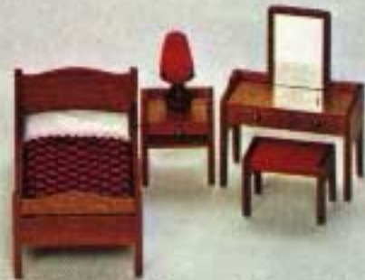
Enkelsäng, mahognylackerad bok 7262. Nattbord 7102. Lampa 6161. Toalettbord och Pall 7114.