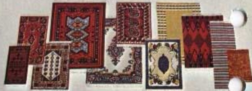
Exempel ur Lundby mattkollektion: Finns både styckvis och i större förpackningar.

Kartongförpackningar: 9302 Bord med två Stolar 3013, Buffé 3081, två Malstolar 3022, Väggar 3830, 9510 Soffa 5148, Fåtölj 5158, Soffbord 5111, TV med Bänk 5194, Småförpackning: 5094 Piano med Pall.