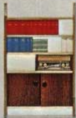
Bokskåp 8460. Radio 5492.