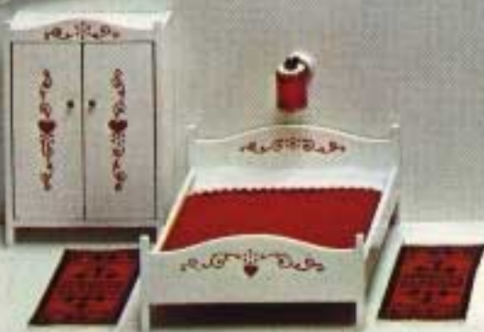
Säng med allmogedekor 7163. Klädskap 7184. Matta "Balkan" 6233. Lampett 6173.

Kartongförpackningar: 9770 Dubbelsäng rokoko 4321, Toalettbord med Pall 4323, två Nattbord 4324. 9710 Två bäddade vita Sängar 7263, två Nattbord 7103, Toalettbord med Pall 7115. 6171 Lampett gul.