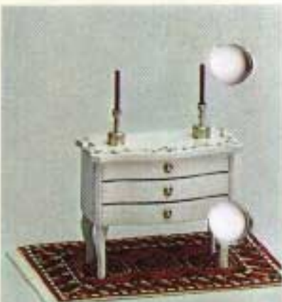
Rokokobyrå 4325. Orientalisk matta 6221.