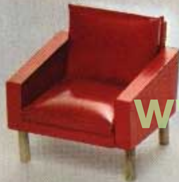
Fåtölj, stoppad skinnimiterad klädsel 5158.