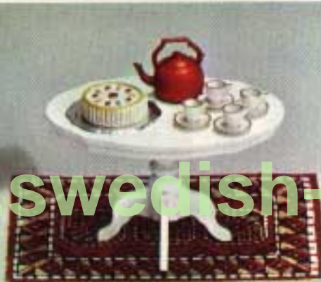
Soffbord, rokoko 4250. "Kaffe-rör" 6604.