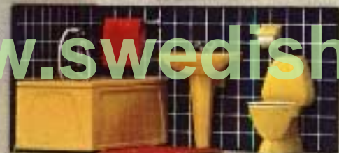
Kartongförpackning: 9880 Badrum. Enheterna finns även i styckförpackningar. Badrumsspegel med belysning 6850.