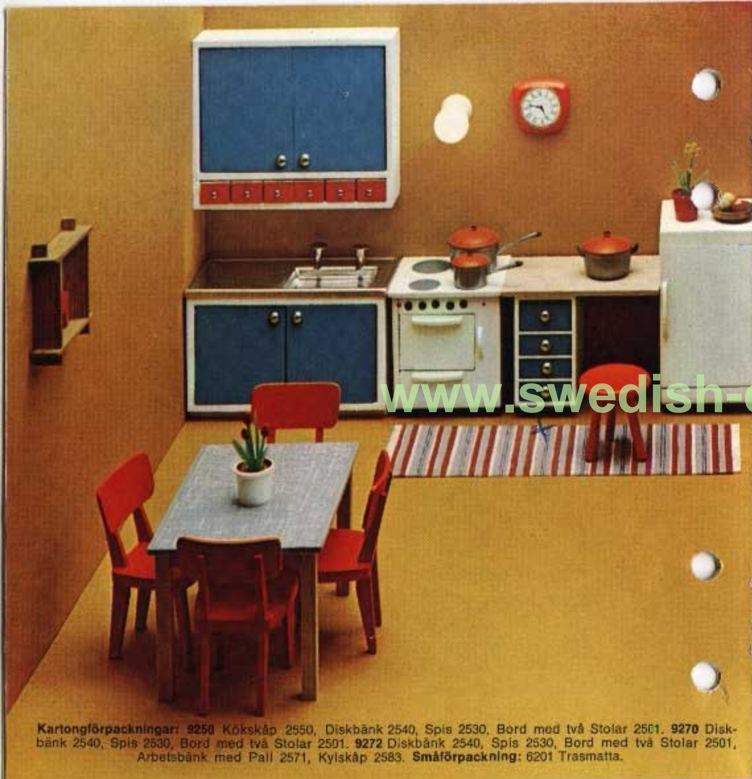
Kartongförpackningar: 9250 Kökskåp 2550, Diskbänk 2540, Spis 2530, Bord med två Stolar 2501. 9270 Diskbänk 2540, Spis 2530, Bord med två Stolar 2501. 9272 Diskbänk 2540, Spis 2530, Bord med två Stolar 2501, Arbetsbänk med Pall 2571, Kylskåp 2583. Småförpackning: 6201 Trasmatta.