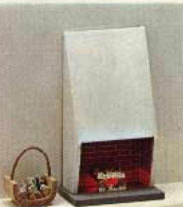
Öppen spis med lampa i brasan 5773. Vedkorg 5772.