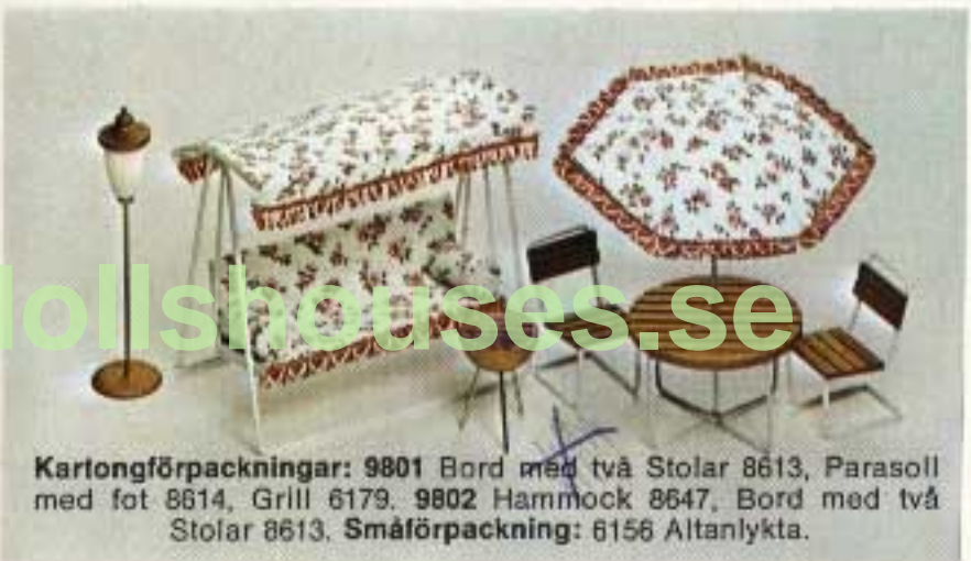
Kartongförpackningar: 9801 Bord med två Stolar 8613, Parasoll med fot 8614, Grill 6179. 9802 Hammock 8647, Bord med två Stolar 8613. Småförpackning: 6156 Altanlykta.