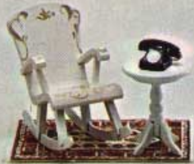
Gungstol 4327. Pelarbord 4113. Telefon 6840. Orientalisk matta 6222.